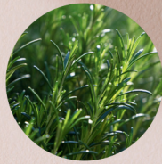
有機無農薬栽培 ローズマリー葉エキス