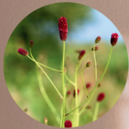
ワレモコウエキス