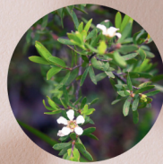
レモンセントティーツリー油

オーガニック原料のなかでも最高峰の「日本有機JAS原料基準」を取得した原料にこだわり、自浄作用を守りつつ清潔に潤いを保ちます。