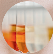
植物性プラセンタ様エキス