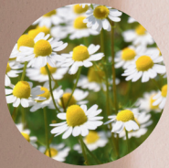
有機JAS認定 カミツレ花エキス