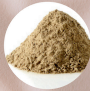
特許取得北海道産 ブライオゾーア抽出水